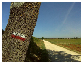
Segnaletica di vernice bianco-rossa a bande orizzontali senza simbolo o scritte