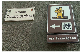
Cartellonistica stradale marrone