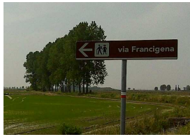
Cartellonistica stradale marrone