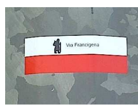
Segnaletica bianco-rossa con o senza simbolo e/o scritta con materiale adesivo