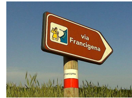
Indicazione sentieristica marrone